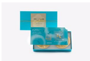
「金の珈琲ゼリー 宵ノ金魚」 (2個入)