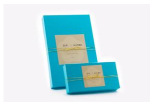
「金の珈琲ゼリー 宵ノ金魚」 (2個入)、(6個入)