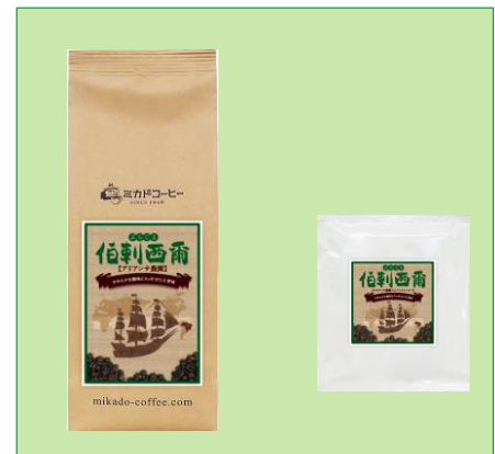
特別パッケージ 左：①レギュラーコーヒー 右：②ワンパック・コーヒー（簡易抽出型）