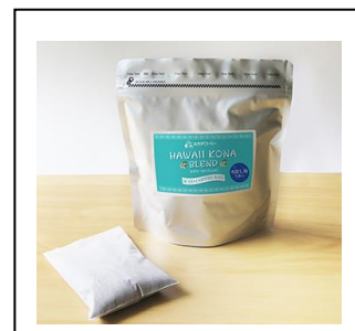
② 商品写真： 「ハワイコナ・ブレンド、 アイスコーヒーパック水出し用」

◆：アイスコーヒーパックのおいしい入れ方：別紙を参照ください。 ①、②、ともに浸す時間は8時間です。