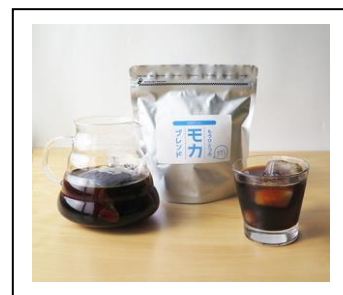
① 商品写真： 「もうひとつのモカブレンド、 アイスコーヒーパック水出し用」