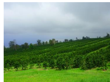
手入りの行き届いた農園 ↑