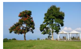
ハワイならではの光景