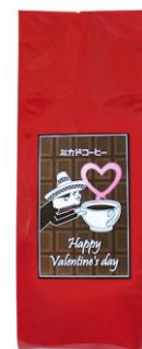
パッケージ (左)レギュラーコーヒー