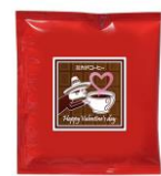
パッケージ (右)ワンパック・コーヒー (簡易抽出型)