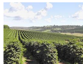
連合会に属する農園 (左)