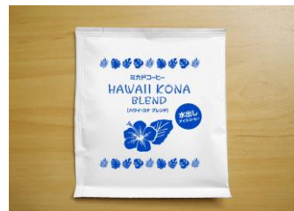
(上) 商品パッケージ（1杯分）↑